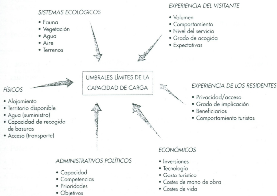
Figura 14.2: Factores que limitan la capacidad de carga.