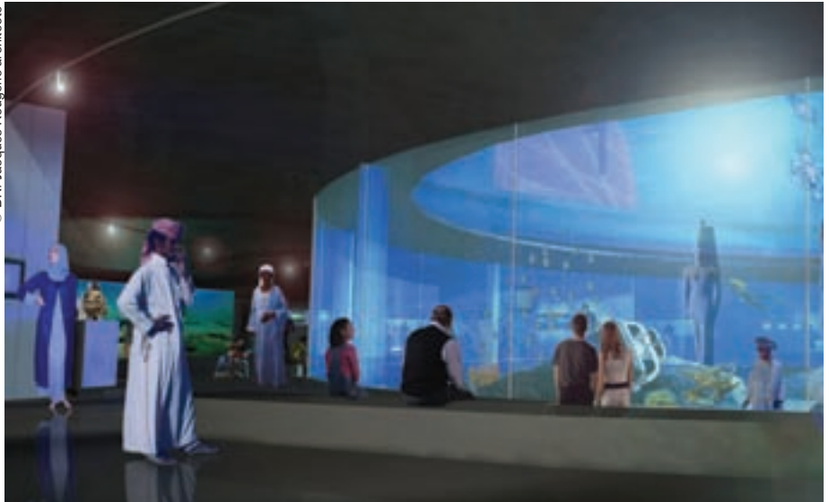
Proyecto de interior del futuro museo submarino de Egipto.