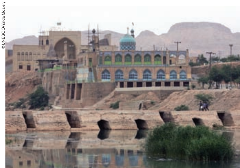
La presa de Band-e Miza en Khuzistán (Irán) forma parte del sistema hidráulico histórico de Shusta, inscrito en la Lista del Patrimonio Mundial.

La Convención de 1972 sobre la Protección del Patrimonio Mundial Cultural y Natural constituye sin duda alguna el instrumento internacional más ampliamente reconocido y el más eficaz en materia de preservación. Uno de sus principales objetivos es "identificar, proteger, conservar, revalorizar y transmitir a las generaciones futuras el patrimonio cultural y natural". Es decir que, cuando un sitio ingresa en la Lista, el proceso no termina allí sino que acaba de comenzar.