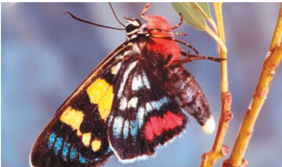
Fraser alberga especímenes raros de la fauna y flora australianas.

Aunque la región de Great Sandy tiene menos de 200.000 habitantes, acoge cada año a 950.000 visitantes. Al Presidente del BMRG le preocupan menos las repercusiones del aumento del turismo que las consecuencias del asentamiento de un número cada vez mayor de personas en la región.