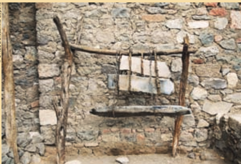
Campana de la iglesia de Neakutdeab, cerca de Lalibela.