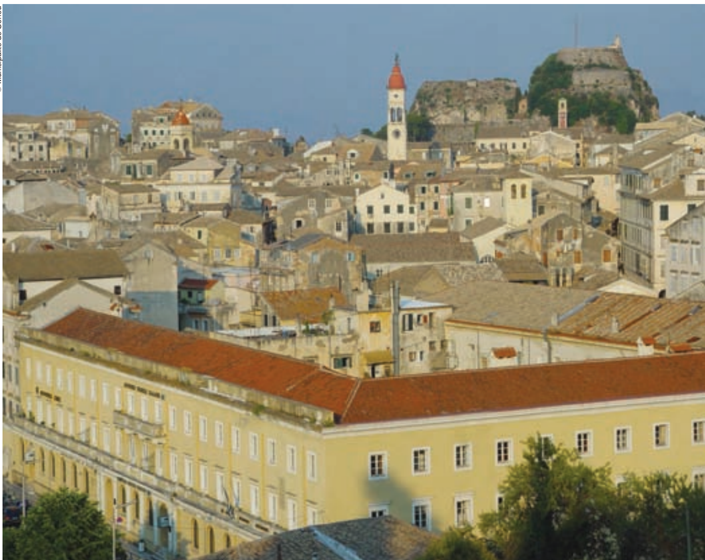
Panorámica desde la vieja muralla.