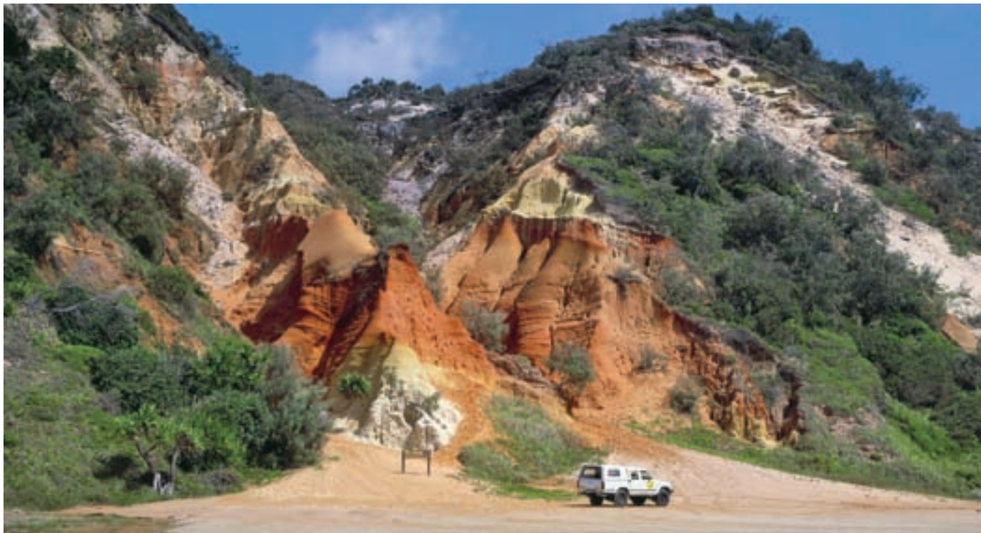
Para visitar la Isla Fraser es imprescindible tomar un barco o alquilar un vehículo con tracción a cuatro ruedas.

de biosfera la tarea primordial es la gestión de las transformaciones de los ecosistemas ocasionadas por las actividades humanas, con vistas a la consecución de un desarrollo sostenible”.