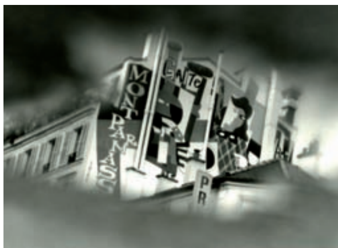
En el marco del Festival de la Diversidad Cultural, organizado por la UNESCO en mayo 2009, Shigeru Asano expuso sus obras en la Alcaldía del primer distrito de París. (© Shigeru Asano)