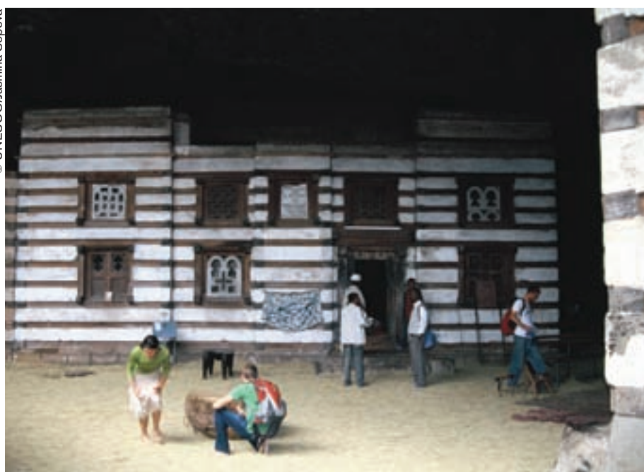
Algunos turistas que se aventuraron hasta la iglesia de Imrahana Kirstos.

Tras mostrarme la cruz que Dios mismo forjó para Imrahana Kirstos, así como un hermoso tríptico pintado por el rey en persona, el sacerdote me permite descubrir el