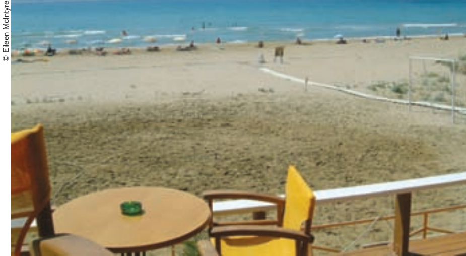
¿El turismo perjudicará a la "anciana aristócrata" que es Corfú?

Los corfíotas están muy orgullosos de su isla y, reconozcámoslo, tienen cierto sentimiento de superioridad respecto de los griegos de otras regiones. Me dirán ustedes que los cretenses también, o los habitantes de las Cícladas. Pero sus motivos son distintos. Son motivos relacio-