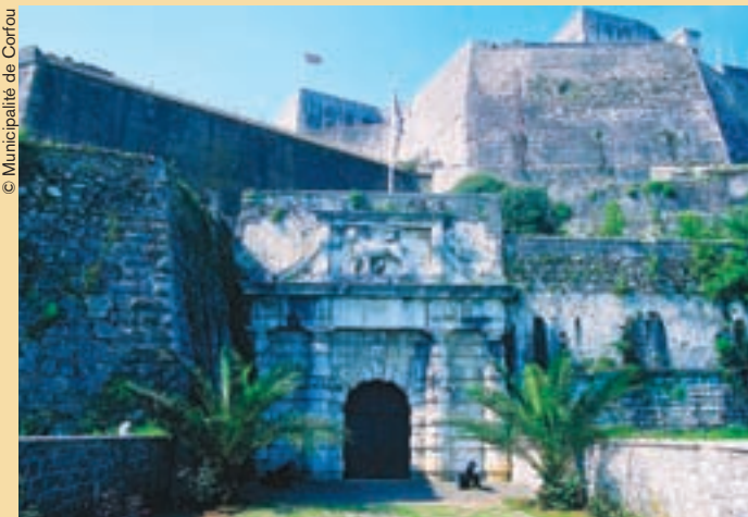
La vieja muralla junto al puerto.

Por otro lado, la Ciudad Vieja de Corfú, con su laberinto de callejuelas vivaces intramuros, actualmente también forma parte del sitio del Patrimonio Mundial. Caracterizada por una arquitectura de estilo italiano, ostenta varias iglesias ortodoxas orientales (una de ellas contiene los restos momificados de San Spiridion) mientras que su amplia explanada incorpora un campo de críquet muy británico. Corfú posee una identidad única por su estructura y su forma, su estilo de vida, sus manifestaciones artísticas y su literatura, por haber asimilado por ósmosis tanto las peculiaridades de Oriente como de Occidente. Este conjunto se ha conservado casi enteramente intacto hasta nuestros días, y el reconocimiento del Centro del Patrimonio Mundial le ayudará a cobrar ímpetu