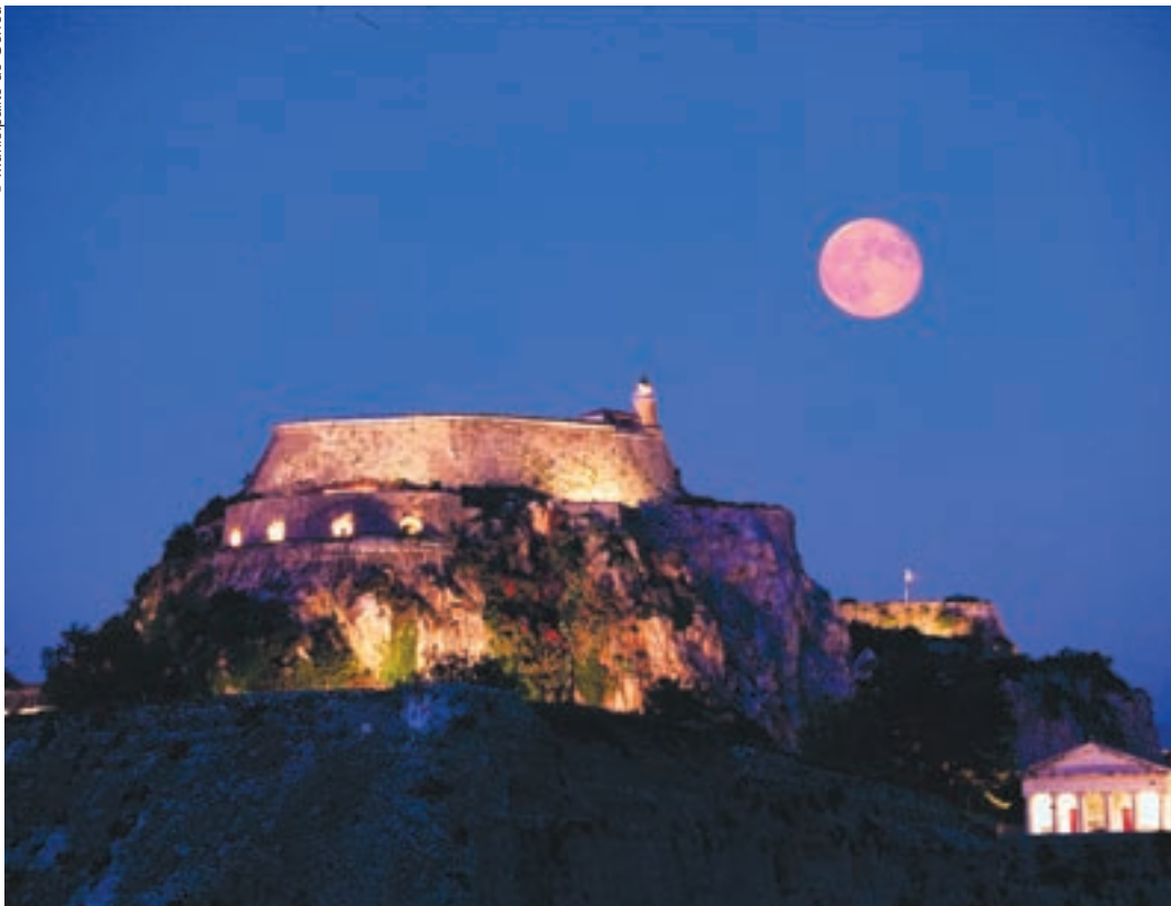
Noche en la ciudad de Corfú (Grecia).