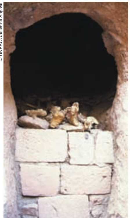
Cavidad en las rocas que circundan la célebre iglesia de San Jorge donde desbordan los pies de santos que reposan allí desde hace siglos.