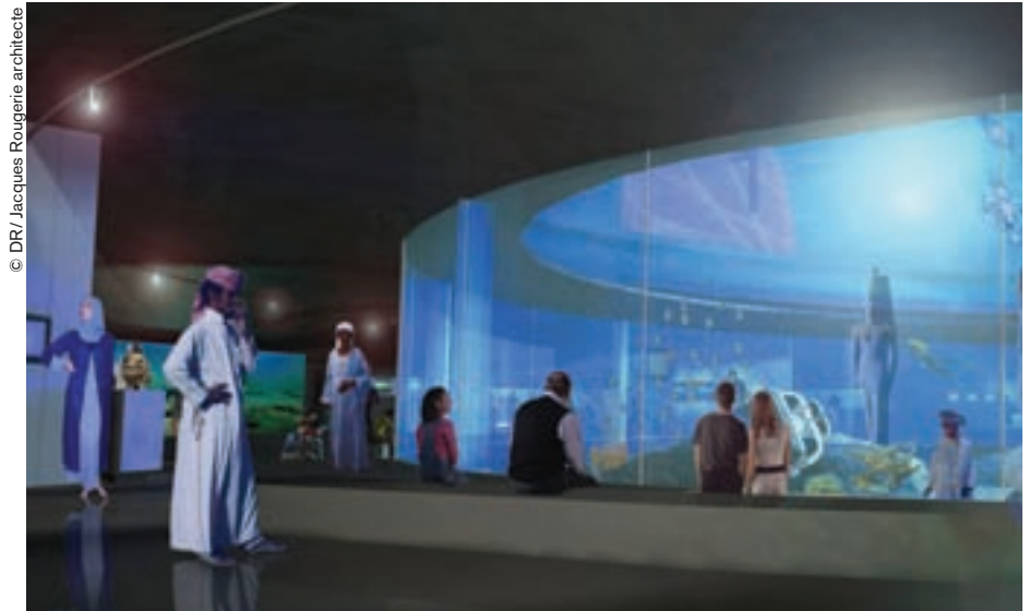
Proyecto de interior del futuro museo submarino de Egipto.

Pero el hombre sigue siendo un peligro. Entre los buceadores existen ciertas ovejas negras que bajo la apariencia de realizar una práctica deportiva en realidad vienen a pillar los sitios. Para apreciar mejor el valor intrínseco de estos lugares, Florian Huber ha creado un grupo de trabajo sobre arqueología marítima y de agua dulce (Amla), que propone cursos periódicos destinados a los buceadores. "Proteger los pecios es sumamente difícil. La única posibilidad es sensibilizar a la gente". Además, estos frágiles vestigios pueden sufrir daños también a causa de las redes de pesca en alta mar, las tempestades o un pequeño molusco llamado broma (Teredo Navalis) que, practicando