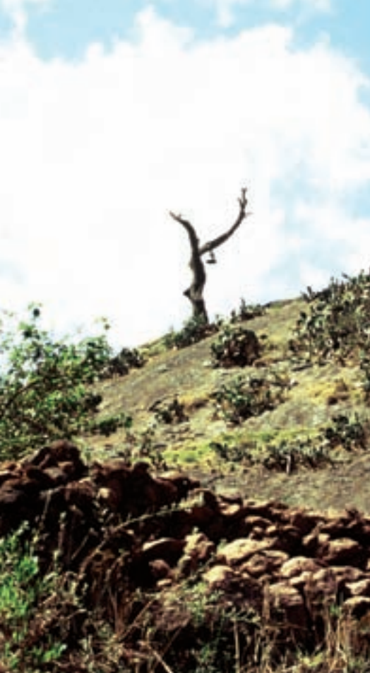
Pequeña colina en Lalibela, llamada Monte Tabor, lugar de la transfiguración de Cristo, en Galilea.